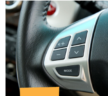
ஸ்டீயரிங் வில்லையே ஆடியோ கன்ட்ரோல் வசதி இருக்கிறது. ஆனால், எல்லாமே இடது பக்கத்தில் இருக்கின்றன!

டர்போ லேக் அதிகமாக இருப்பதால், ஆர்பிஎம் மீட்டர் 2200-ஐ தாண்டும் வரை எவ்வளவுதான் ஆக்ஸிலரேட்டரை மிதித்தாலும் வேகம் போக மறுக்கிறது. இதனால், டிராஃபிக் சிக்கல்களில் இருந்து ஆக்ஸிலரேட்டரை மிதித்து ஆர்பிஎம் 2200-ஐ தாண்டு வதற்குள் அடுத்த சிக்கல் வந்துவிடுகிறது. இதனால், நகருக்குள் ஓட்டுவதற்குச்