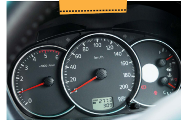
டயல்கள் ரொம்ப சிம்பிள். குறிப்பிட்டுச் சொல்ல எந்தச் சிறப்பம்சங்களும் இல்லை!

ஸ்போர் வில் காருக்கு அடியில் சென்று விட்டதால், காரின் டிக்கியைத் திறப்பது போல கதவை மேல் நோக்கித் திறக்கலாம்.